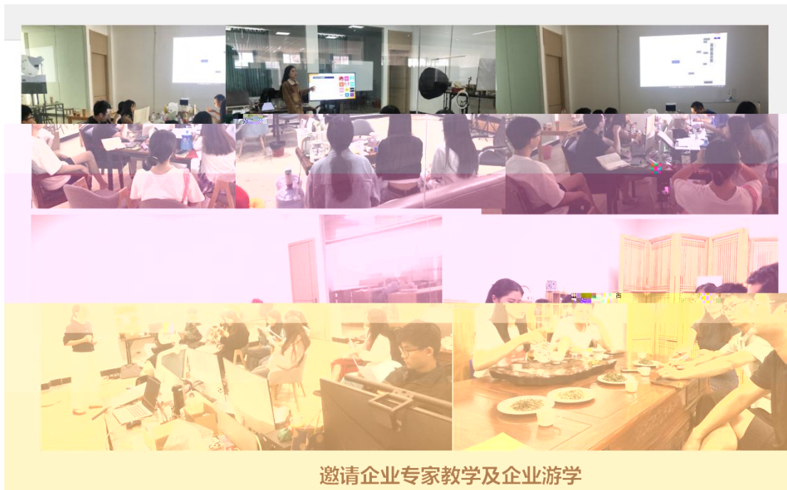
邀请企业专家教学及企业游学